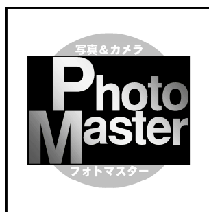
フォト検マーク(モノクロ)