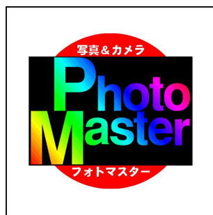
フォト検マーク(カラー)

1: 「フォトマスター検定」という当検定試験名を表示した文書、配布物、ホームページ、名刺、ポスター、ノベルティグッズ、その他一切の製作物に類するもの(以下、「製作物」という。)において使用することができる当検定試験を表すイメージロゴデザイン(以下、「ロゴ」という。)として、以下の意匠を定める。