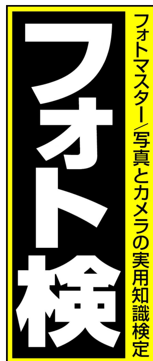
フォト検ロゴ(縦型)